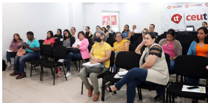
ACTIVAR - Inducción de la 4 o Generación con 30 Mujeres