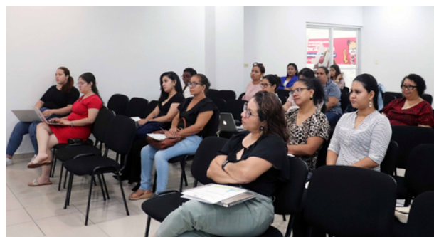
ACTIVAR - Inducción de la 3 o Generación con 36 Mujeres