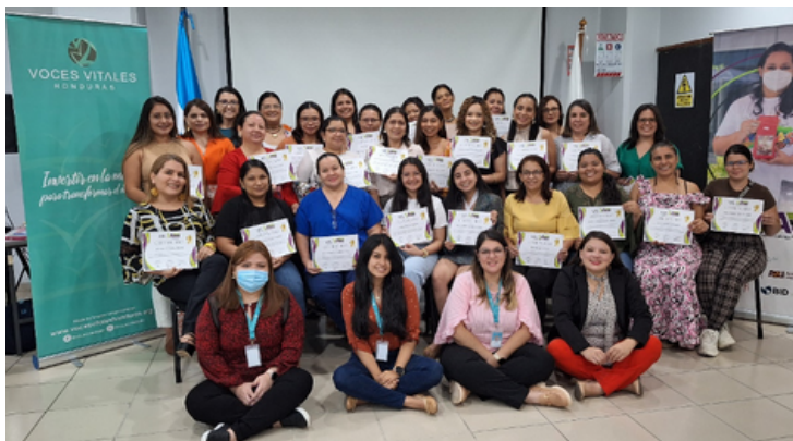
ACTIVAR - Graduación de la 2° Generación