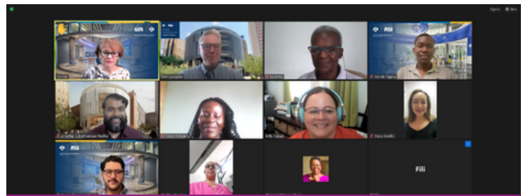
Evento de networking con participantes de Guyana